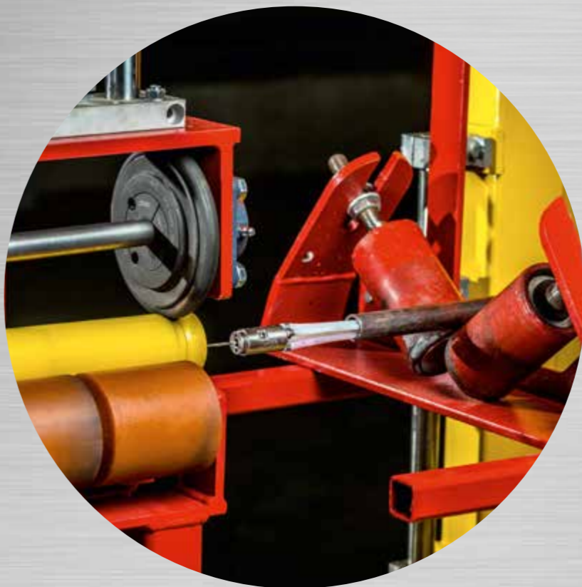
Het aanbrengen van Modinac is precisiewerk en geschiedt door insputting via een lans.