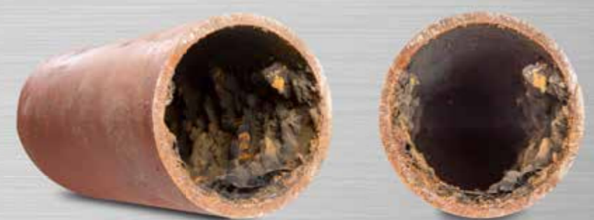
Bacterie-, roest- en vuilaanslag in stalen buizen en sprinklersystemen verhinderen een goede doorstroom van bluswater.

Dan is het een geruststellende en veilige gedachte dat de buizen van C-PIPES zijn voorzien van Modinac. Deze beschermende en zuiverende coating gaat corrosievorming in de buizen tegen en voorkomt bacteriegroei en vuilaanslag. Een verhoogde brandveiligheid dus.